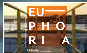
Η Ελευσίνα επελέγη ως Πολιτιστική Πρωτεύουσα της Ευρώπης για το 2021