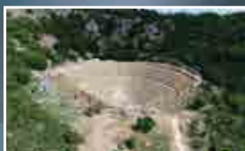
Διάζωμα: νέα ζωή στα αρχαία θέατρα Λάρισας και Κασσώπης