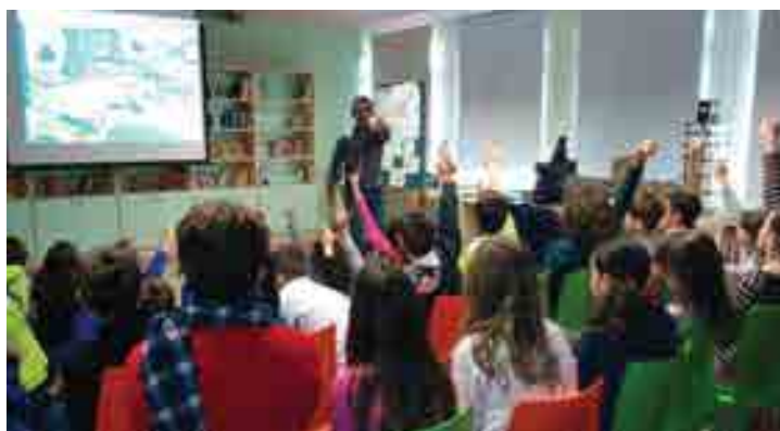
1ο Δημοτικό Σχολείο Παλαιοκάστρου

Οι νομοί που έχουν καλυφθεί από την έναρξη του προγράμματος και μέχρι σήμερα είναι οι εξής: Αττικής, Αιτωλοακαρνανίας, Αχαΐας, Βοιωτίας, Ζακύνθου, Ηλείας, Ηρακλείου, Θεσσαλονίκης, Ιωαννίνων, Κορινθίας, Ρεθύμνου, Φθιώτιδας, Χαλκιδικής και Δωδεκανήσων (Κως, Λέρος, Ρόδος).