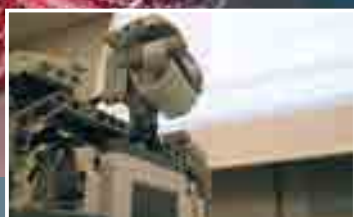
Σεμινάρια εκπαιδευτικής ρομποτικής για μαθητές, στη Νέα Ευκαρπία