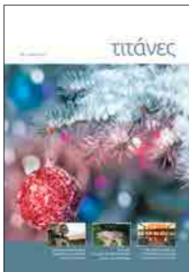
Τεύχος 126 • Δεκέμβριος 2016

ΕΚΔΟΤΗΣ: Ανώνυμος Εταιρία Τσιμέντων ΤΙΤΑΝ