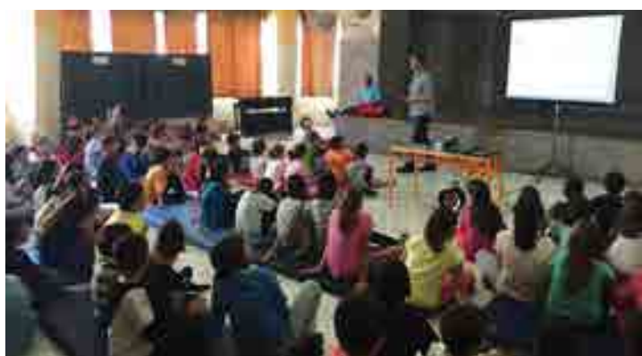
Δημοτικό Σχολείο Μελισσίων