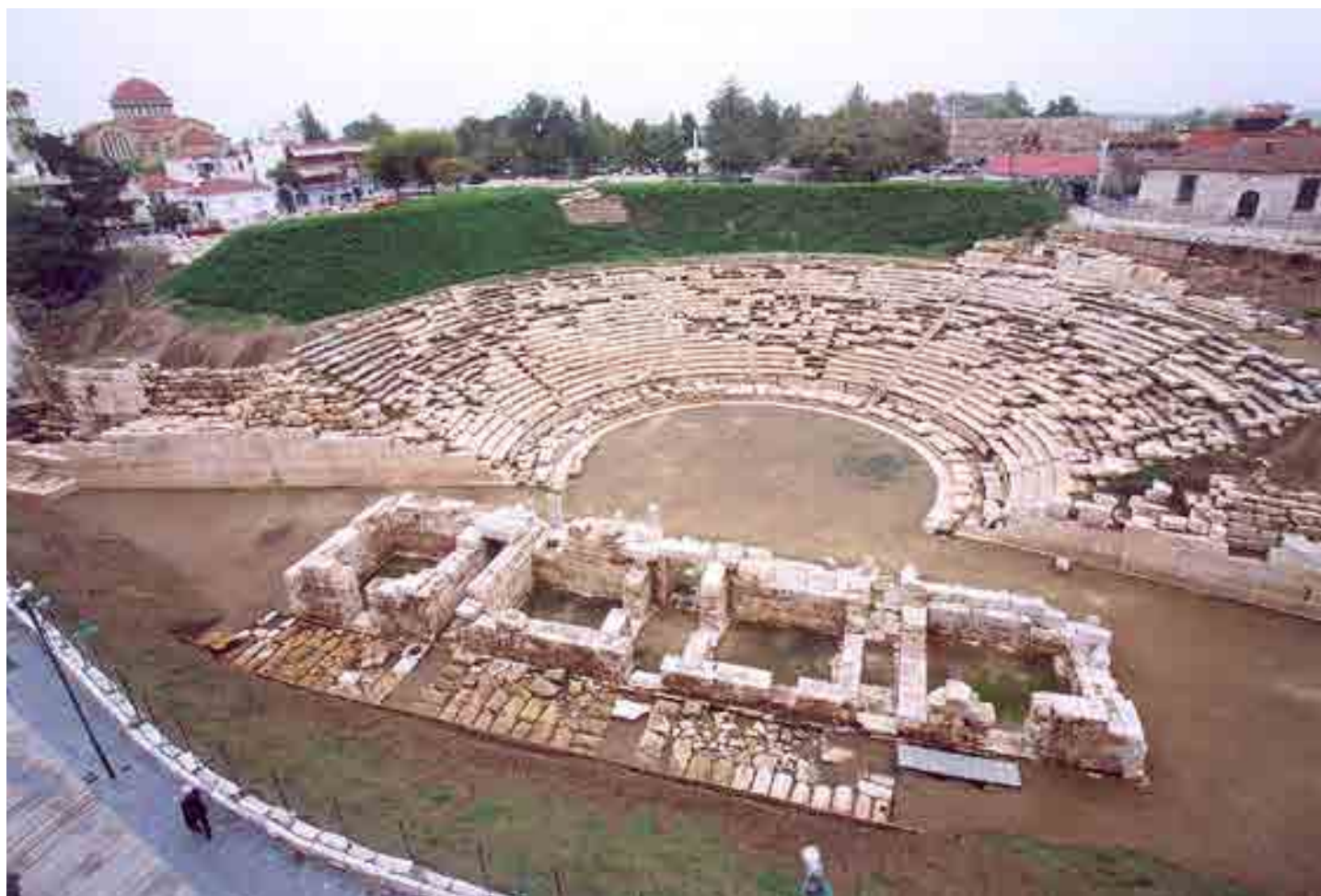
Αρχαίο Θέατρο Λάρισας