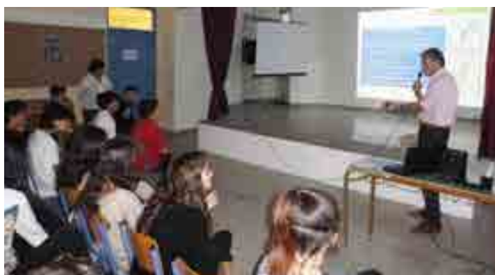
6ο Γυμνάσιο Γαλασίου