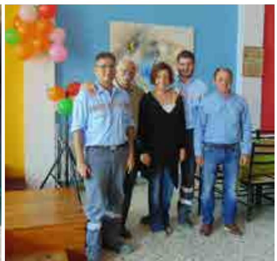
Οι συνάδελφοι των εργοστασίων Καμαριού (αριστερά) και Ελευσίνας παραδίδουν τα Κοινωνικά Βραβεία τους.