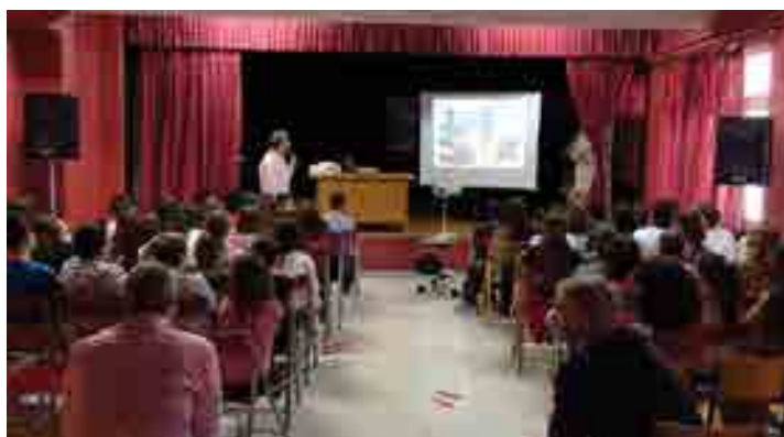
2ο Γυμνάσιο Αλίμου