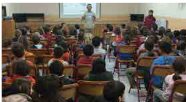
Δημοτικό Σχολείο Μελισσοχωρίου