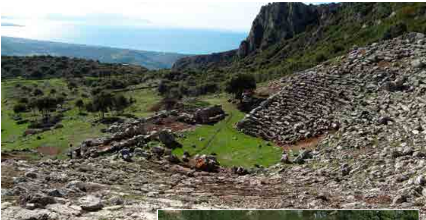
Αρχαίο Θέατρο Κασσώπης

έμεινε ανέγγιχτο από ανθρώπινο χέρι, το Διάζωμα υλοποιεί μαζί με την Εθνική Τράπεζα, εταιρικό μέλος του Σωματίου, το πρόγραμμα συγκέντρωσης πόρων Crowdfunding για την ανάδειξη του σπουδαίου αρχαίου θεάτρου της Κασσώπης μέσω της πλατφόρμας "ACT4 GREECE", της Εθνικής Τράπεζας ( www.act4greece.gr/faq/ ). Η δράση αυτή, που έχει τίτλο «Αρχαίο Θέατρο Κασσώπης» και προσφέρει συμβολικά αντισταθμίσματα, ως ηθική επιβράβευση για τους δωρητές, θα διαρκέσει έως τις 31 Δεκεμβρίου 2016, με στόχο να συγκεντρωθεί το ποσό των 80.000 ευρώ, για τη χρηματοδότηση της εκπόνησης της μελέτης αποκατάστασης του αρχαίου θεάτρου.