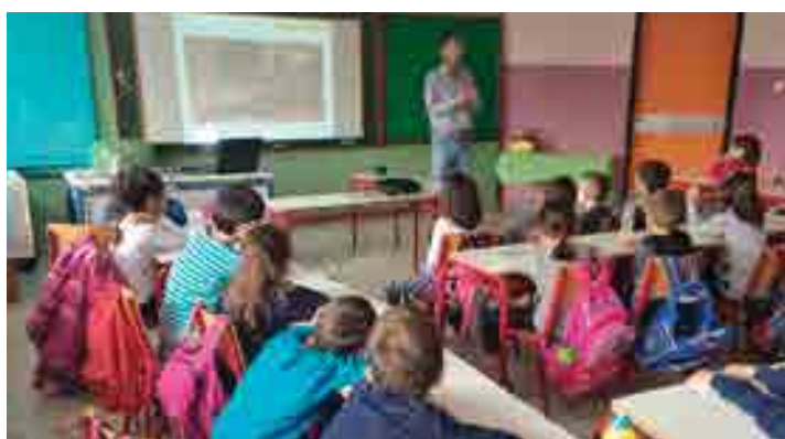
Δημοτικό Σχολείο Ελευθ. Κορδελιού Λέρου