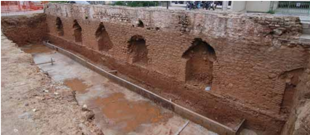
Άποψη τμήματος του ρωμαϊκού υδραγωγείου στην οδό Δήμητρος (2011)

Ο Αδριανός ήταν αυτός που προσέφερε στην πόλη της Ελευσίνας το πρώτο της υδραγωγείο, η κατασκευή του οποίου πρέπει να συνδέεται με τη μύηση του ίδιου του αυτοκράτορα στα Ελευσίνια Μυστήρια, το 125 μ.Χ. Η «πορεία» του υδραγωγείου μέσα στη σύγχρονη πόλη της Ελευσίνας είναι ορατή ακόμα και σήμερα, με χαρακτηριστικότερα τα μεγάλα τμήματά του που διακρίνονται κατά μήκος της οδού Δήμητρος.