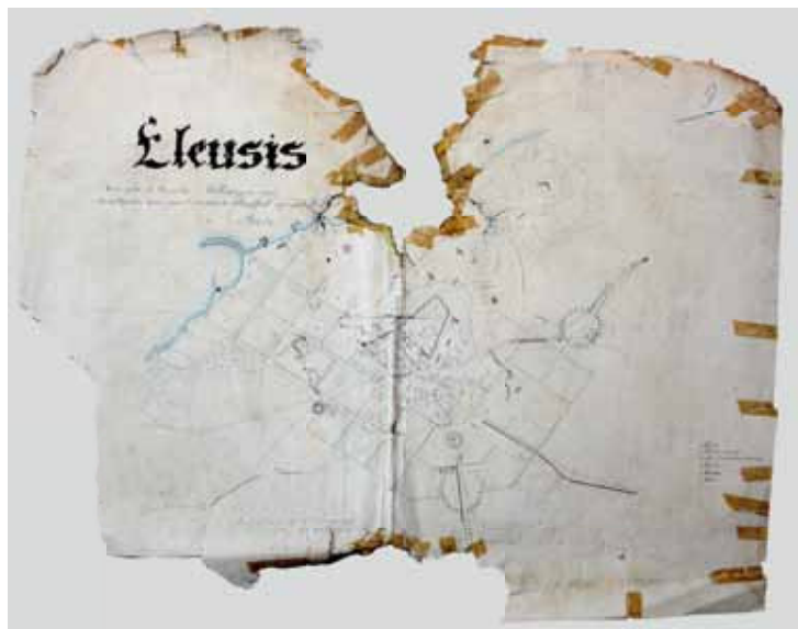
Σχέδιο 1835 του γεωμέτρη C. Mitteregger

Το 1811 έφτασαν εκεί μέλη της Εταιρίας των Dilettanti, που είχε ιδρυθεί στη Μεγάλη Βρετανία από αρχαιόφιλους αριστοκράτες, μελετητές και θαυμαστές του αρχαίου ελληνικού και ρωμαϊκού πολιτισμού. Ακολούθησε ο Γάλλος αρχαιολόγος Φρανσουά Λενορμάν (1837-1883), ο οποίος πραγματοποίησε ανασκαφές στην Ελευσίνα το 1860. Η πιο συστηματική έρευνα στην πόλη ξεκίνησε το 1882 από την Εν Αθήναις Αρχαιολογική Εταιρεία και συνεχίστηκε κατά το μεγαλύτερο μέρος του 20ού αιώνα με το σημαντικό ανασκαφικό έργο Ελλήνων αρχαιολόγων, όπως ο Δημήτριος Φίλιος (1844-1907), ο Κωνσταντίνος Κουρουνιώτης (1872-1945), ο Ιωάννης Τραυλός (1908-1985), ο Ιωάννης Θρεψιάδης (1907-1962) και ο Γεώργιος Μυλωνάς (1898-1988). Το πλούσιο έργο της Εν Αθήναις Αρχαιολογικής Εταιρείας στην Ελευσίνα κράτησε σχεδόν έναν ολόκληρο αιώνα και έφερε στο φως το σύνολο του ναού της Δήμητρας, ένα μεγάλο μέρος από την οχύ-