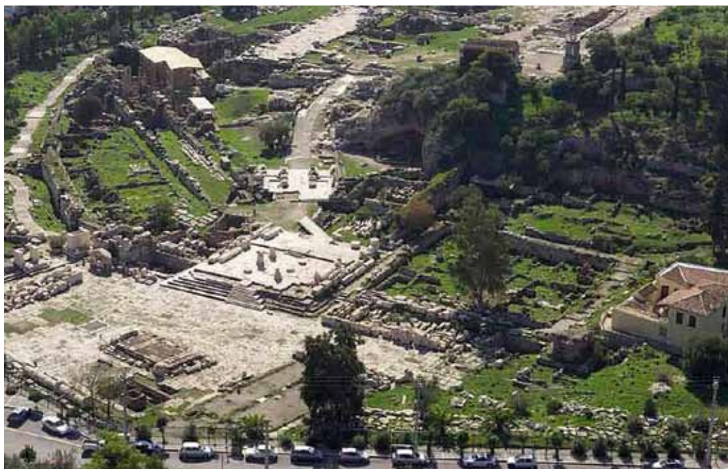
Αεροφωτογραφία της βόρειας περιοχής του αρχαιολογικού χώρου (2008)

Ο αρχαιολογικός χώρος της Ελευσίνας μπορεί να αποτελέσει στο μέλλον το βασικό κομβικό σημείο του δικτύου πολιτιστικών διαδρομών, που θα συνδέεται με την Αθήνα μέσω της Ιεράς Οδού και θα οδηγεί σε όλα τα σωζόμενα μνημεία της πόλης τα οποία παρουσιάζουν μεγάλο αρχαιολογικό ενδιαφέρον.