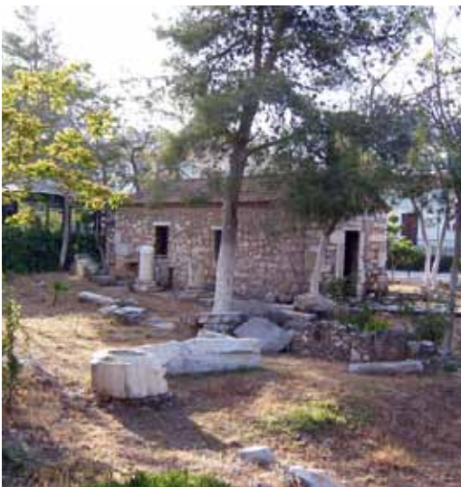
Το εκκλησάκι του Αγίου Ζαχαρία (2010)

Το εκκλησάκι του Αγίου Ζαχαρία στην πόλη της Ελευσίνας είναι χτισμένο πάνω στα ερείπια παλαιοχριστιανικής βασιλικής του 5ου αιώνα μ.Χ., ενός από τους πρώτους τόπους λατρείας της νέας Χριστιανικής θρησκείας, μετά την ουσιαστική κατάργηση του ναού της Δήμητρος.