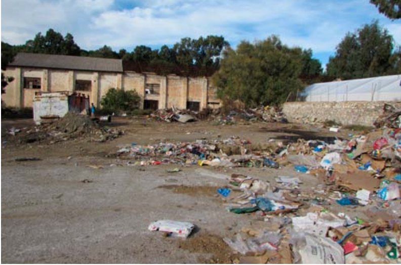
Η δημιουργία του καταυλισμού